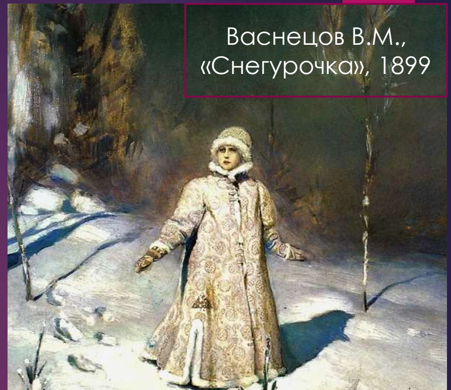
Васнецов В.М., «Снегурочка», 1899

Островский Александр Николаевич Снегурочка (АУДИОКНИГИ ОНЛАЙН) Слушать